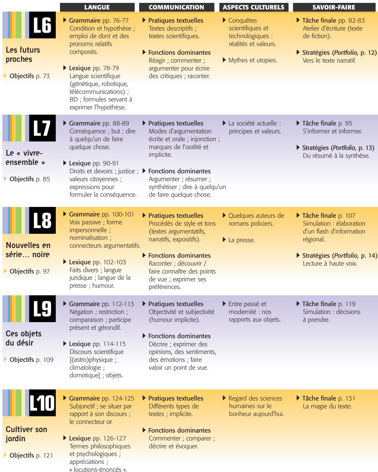
TABLE DES MATIÈRES / CONTENUS